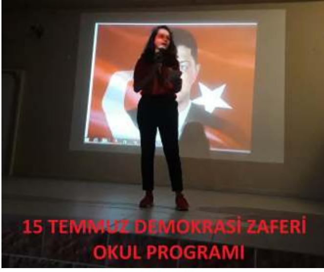
15 TEMMUZ DEMOKRASİ ZAFERİ OKUL PROGRAMI