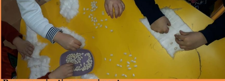
Bean germination experiment, Giant bean story, Bean tree art activity.