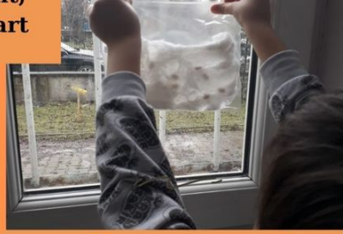
Growing seeds and organic plants