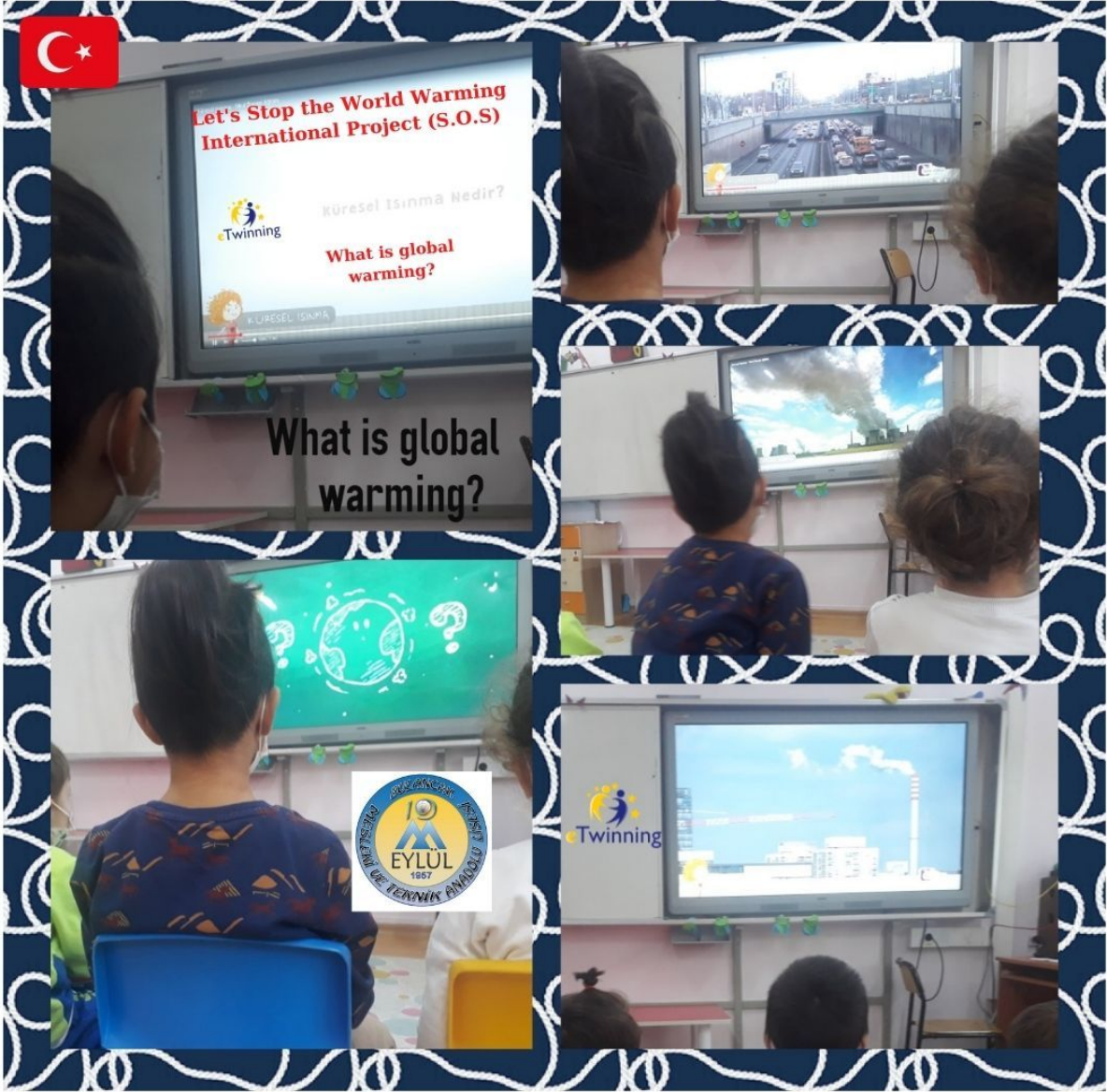
Küresel ısınma ile ilgili bilgilendirme