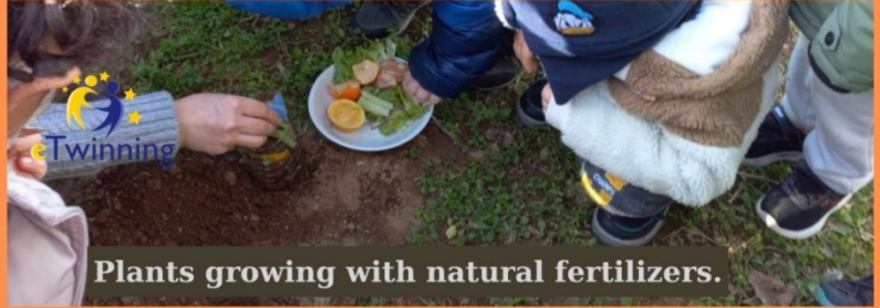
Plants growing with natural fertilizers.