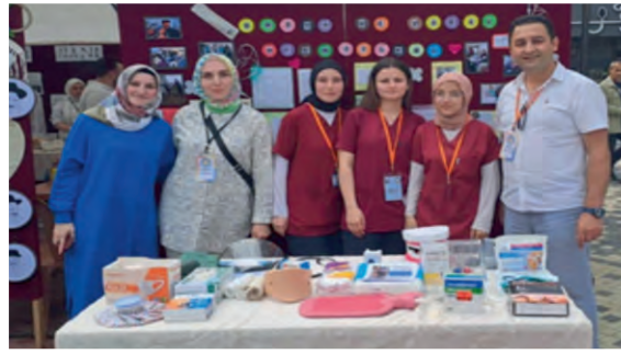
HASTA VE YAŞLI BAKIM HİZMETLERİ ALANI