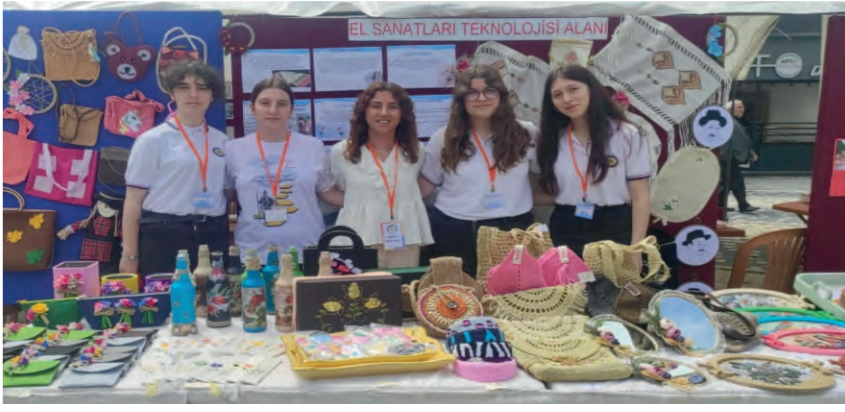
EL SANATLARI TEKNOLOJİSİ ALANI