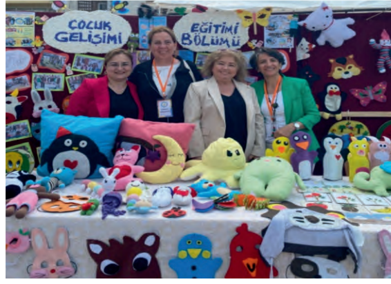
ÇOCUK GELİŞİMİ VE EĞİTİMİ ALANI