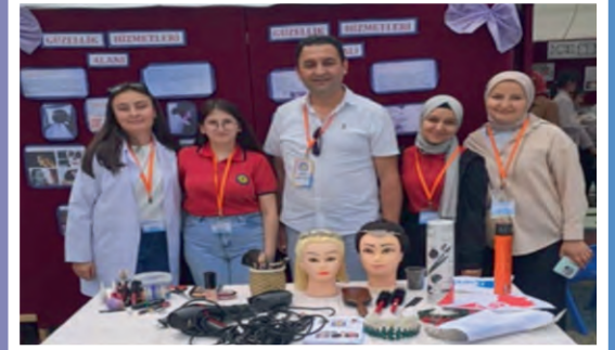
GÜZELLİK VE SAÇ BAKIM HİZMETLERİ ALANI